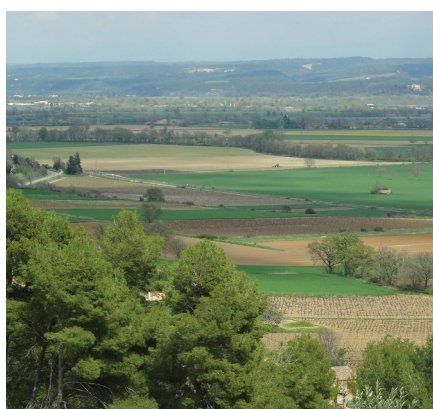
De haut en bas : La mairie Fontaine Ecole Chapelle St Brice Plaine de la Durance